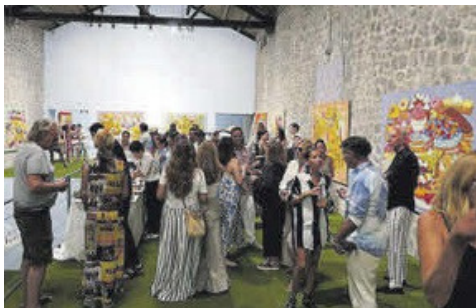
Más de 200 personas asistieron a la inauguración.