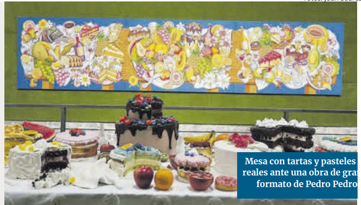
Mesa con tartas y pasteles reales ante una obra de gran formato de Pedro Pedro