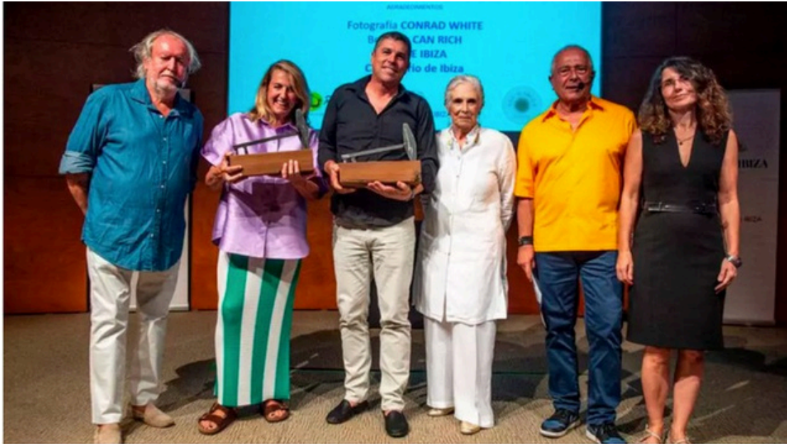
Ceremonia de entrega de La Llave de Ibiza el año pasado.