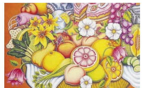
La muestra 'Picnic' presenta 17 obras de gran formato.