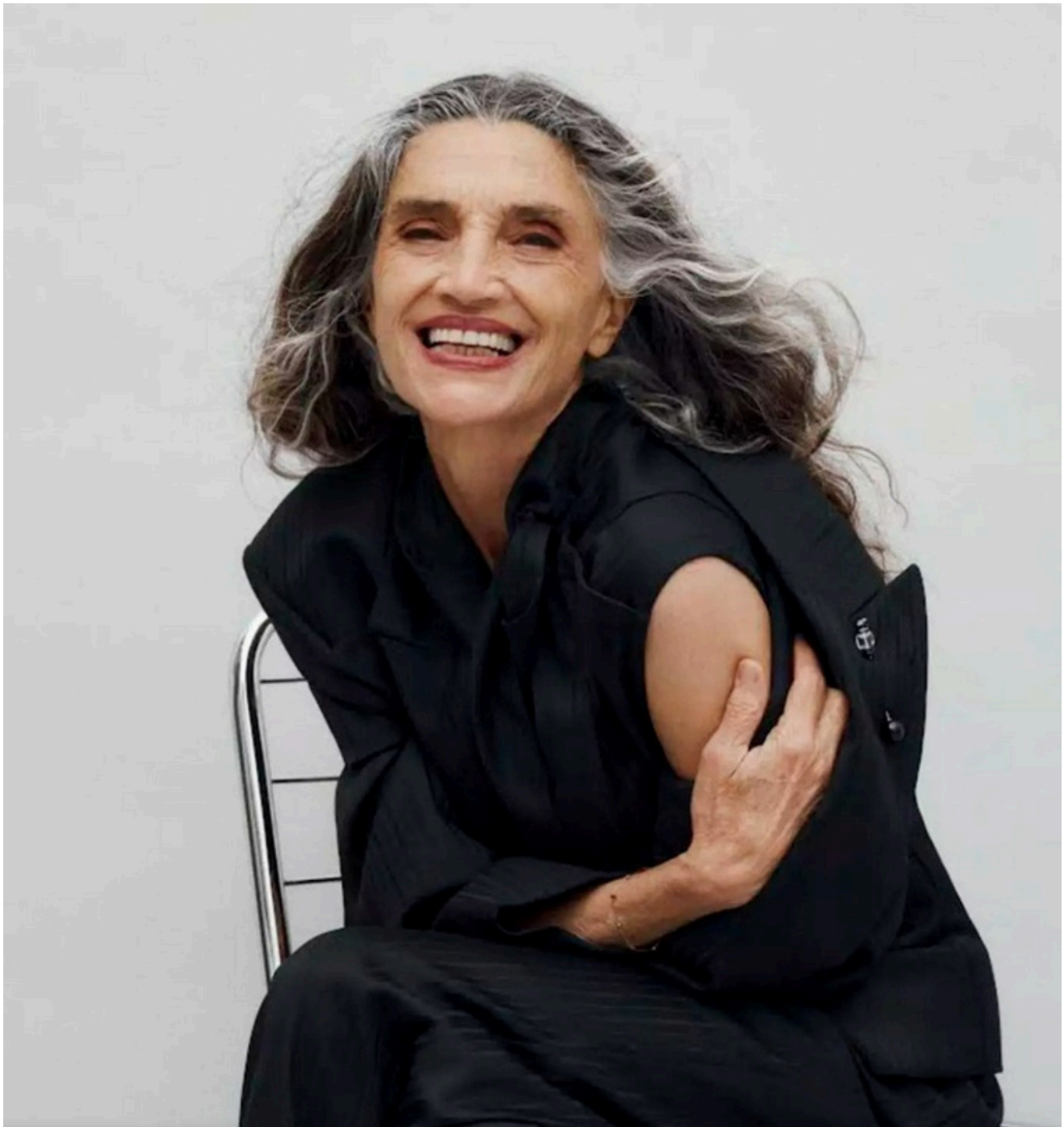
La actriz Ángela Molina galardonada con La Llave de Ibiza de 2025.

Molina es una leyenda viva del cine español, se ha metido en la piel de más de 100 mujeres en películas y series como 'Ese oscuro objeto de deseo', 'Las edades de Lulú', 'Carne trémula', 'Los abrazos rotos', 'Los Borgia', 'Las cosas del querer', 'La conquista del paraíso' o 'El árbol de la sangre', entre otras.