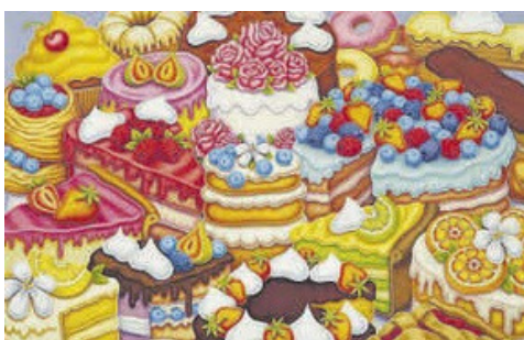
Pasteles y exquisitas frutas como motivo de arte.