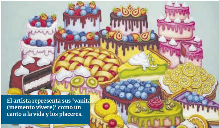
El artista representa sus 'vanitas (memento vivere)' como un canto a la vida y los placeres.